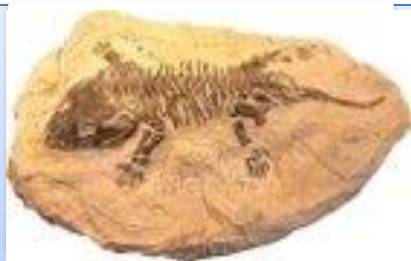
Line of Inquiry #1: Types of fossils.