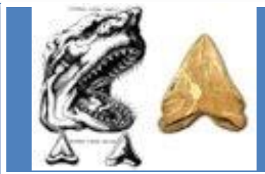
Line of Inquiry #2: Fossils as clues to the past.