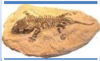
Línea de consulta # 1: Tipos de fósiles.