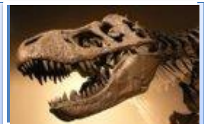
Line of Inquiry #3 and #4: • Fossils as evidence • Fossil formation