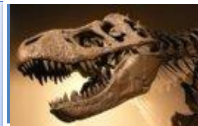
Línea de consulta # 3 y 4: • Fósiles como evidencia • Fósiles de formación