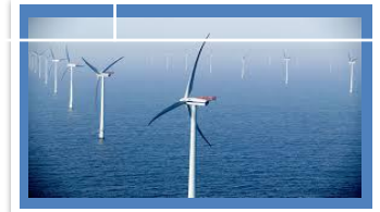
Línea de consulta #3:

Los cambios de la Tierra ocurren rápidamente.