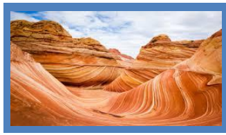
Línea de consulta #1:

Los cambios de la Tierra ocurren lentamente.